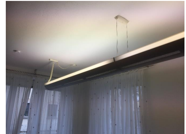
Alte Beleuchtung im Rathaus

Ziel der Gemeinde Tiefenbach ist es, durch die Anpassung der vorhandenen, veralteten und mit einem hohen Energieverbrauch gekennzeichnete Beleuchtung im Rathaus und im Bauhof auf den aktuellen Stand der Technik, einen wesentlichen Teil zur Minderung von CO 2 -Emissionen und damit zum Klimaschutz beizutragen. Durch den geringeren Energieverbrauch können außerdem Stromkosten eingespart werden. Aufgrund der hier eingesetzten, neuartigen LED-Technik kann beispielsweise flexibel auf unterschiedliche Tageszeiten reagiert werden. So kann die Beleuchtungsstärke durch den Einbau dimmbarer Leuchten bewusst an diese Zeiten angepasst werden. Des Weiteren weisen diese Leuchten einen weitaus höheren Wirkungsgrad und eine höhere Lebensdauer als die bestehende Beleuchtung auf.