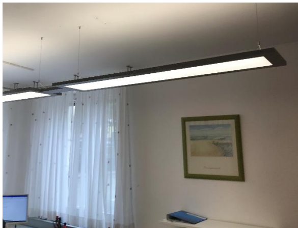
Neue Beleuchtung im Rathaus

In ausgewählten Bereichen des Rathauses und des Bauhofes der Gemeinde Tiefenbach soll die Beleuchtung auf LED-Technik umgestellt werden. Der Austausch der Beleuchtung ist in diesen Bereichen erforderlich, da die eingesetzten Leuchten bereits ein hohes Alter aufweisen und teilweise die geforderte Beleuchtungsstärke unter den vorgeschriebenen Werten liegt. Das Förderprogramm gibt dem Vorhaben der Gemeinde Tiefenbach neue Impulse. So können durch die Förderquoten von 30% mehr Leuchten saniert bzw. ausgetauscht werden als es in der ursprünglichen Absicht der Kommune lag. Nach erfolgreichem Abschluss der Arbeiten sollen die Ergebnisse zusammengestellt und bekannt gemacht werden. Diese sind Einsparung der elektrischen Energie, Absenkung des Beleuchtungsstärkeniveaus bei Tageslicht, Minderung der CO 2 -Emissionen sowie die tatsächliche Amortisationszeit des Vorhabens.