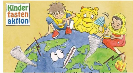
Rucky und die Klimadetektive

Hast du Lust gemeinsam mit Rucky Reiselustig und den Klimadetektiven von MISEREOR auf die Spurensuche nach den Ursachen und Auswirkungen des weltweiten Klimawandels zu gehen? Super dann bist du bei uns genau richtig. Wir reisen nach Bangladesch und schauen wie die Menschen dort leben, ziehen Vergleiche zu unserem Leben hier und überlegen, was das alles mit dem Klimawandel zu tun hat.