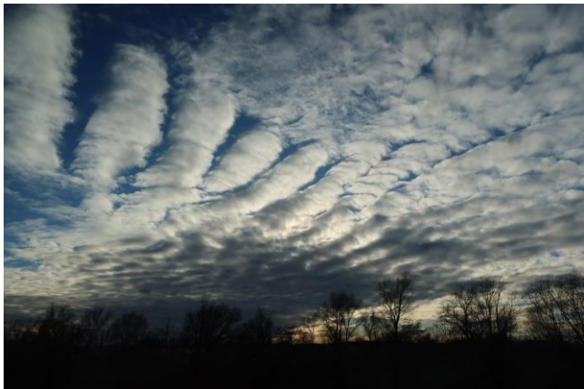
Schöne Wolkenbilder erheitern das Gemüt.

Also nichts wie raus, bewegen, genießen und gesund bleiben.