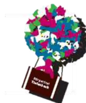
Christian Fürst 1. Bürgermeister