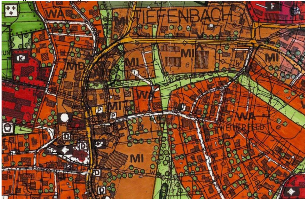
Abb. 1: Auszug derzeit rechtsgültiger FNP der Gemeinde Tiefenbach im Maßstab 1:5000

Das Plangebiet ist derzeit im Flächennutzungsplan der Gemeinde Tiefenbach als MI (Mischgebiet) nach § 6 BauGB dargestellt.