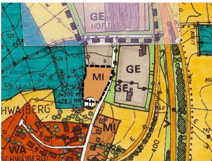
geänderter Flächennutzungsplan mit DB 16 M1:5000