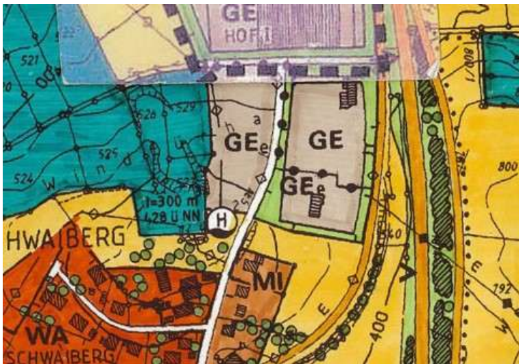
Bisher gültiger Flächennutzungsplan M1:5000